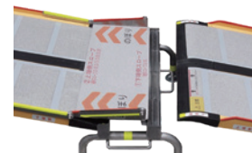
下端側スロープ受け