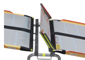
上端側スロープ受け