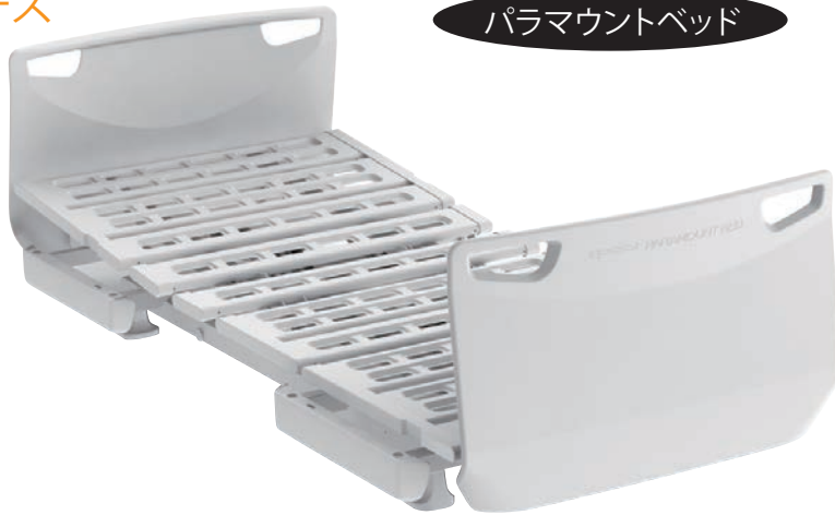
パラマウントベッド