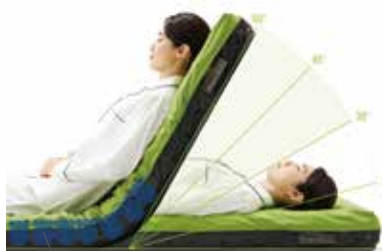
底つき防止 エアセルが体重をしっかり支え、底つきのリスクを防ぎます。