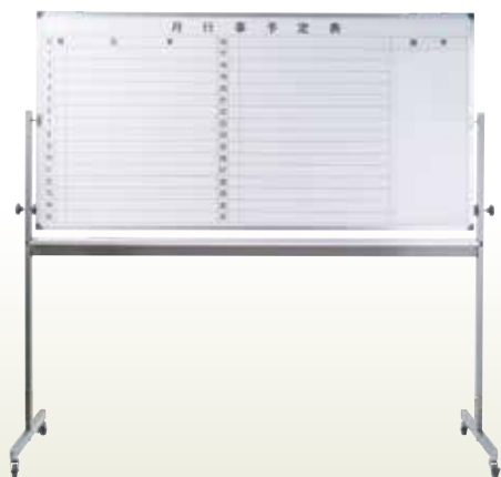
可動ホワイトボード 月予定横書 6 [コード]05027-37