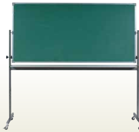
可動黒板両面 6 [コード]05025-26