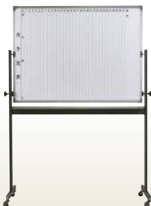
可動ホワイトボード 月予定 4 [コード]05027-34