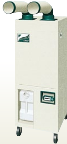
スポットエアコン 2人用 スリム三相200 [コード]07820-31