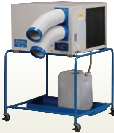
スポットエアコン 2人用 三相200 [コード]07820-32