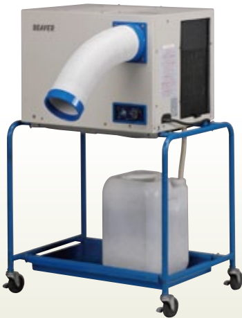
スポットエアコン 1人用 単相100 [コード]07810-12