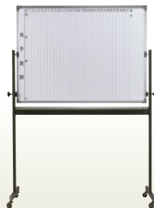
可動ホワイトボード月予定 6