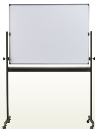
可動ホワイトボード無地 6