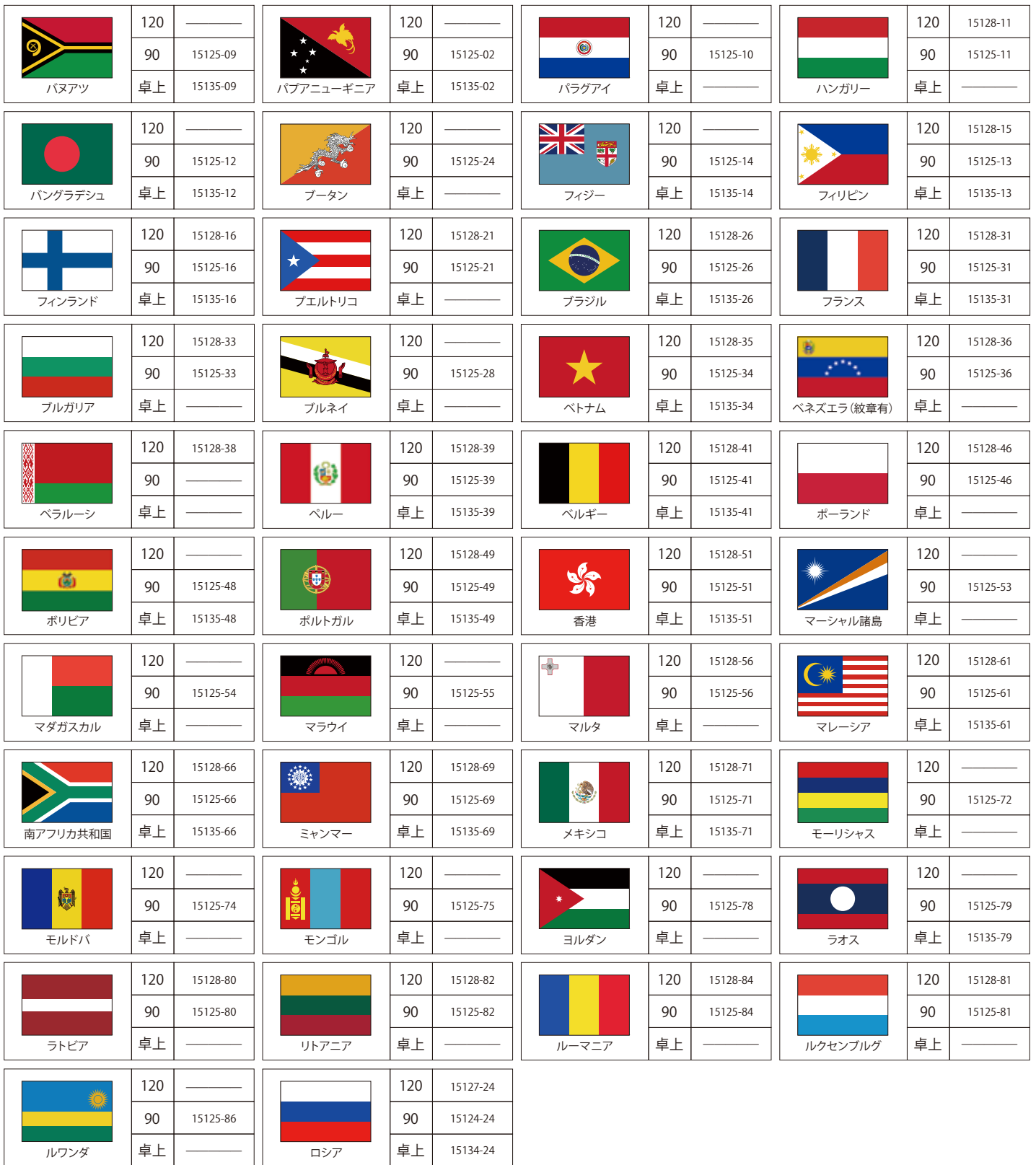
卓上国旗台 2本立て W280×D80×H420