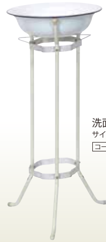
洗面器 台付 サイズ: φ320 H700 [コード] 11141-31