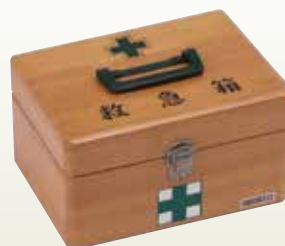
救急箱 (薬別) サイズ: W220×D170×H130 [コード] 13146-46