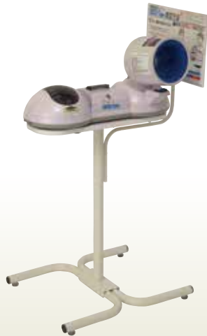
全自動血圧計 専用架台付 プリンター内蔵 UDEX-TWIN2 [コード] 13146-39