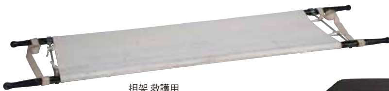
担架 救護用 サイズ: W550×L2,100 [コード] 13146-41