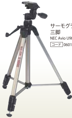
サーモグラフィ用 三脚 NEC Avio U9800 [コード] 06019-12