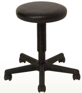
全自動血圧計 専用椅子 キャスター付 UDEX-TWIN2 [コード] 13146-42