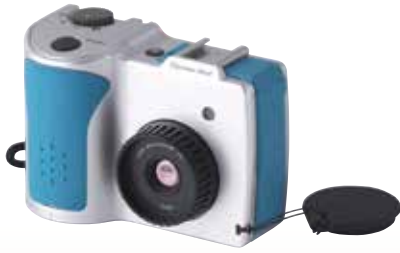
サーモグラフィ F30W NEC Avio F30W-A01BL [コード] 06019-11