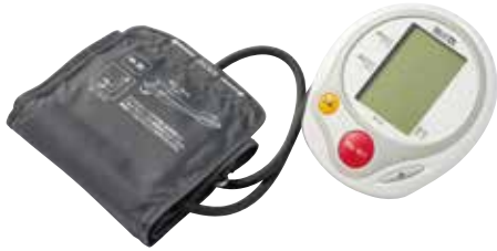
血圧計 デジタル式 [コード] 13146-36