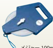
メジャー 100m サイズ:100m [コード] 13024-18