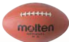
ラグビーボール [コード] 13005-21