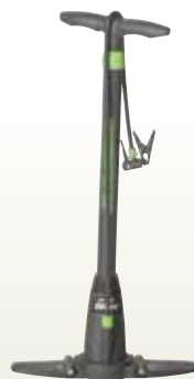
ボール空気入れポンプ [コード] 13007-11