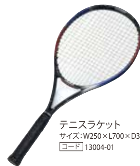
テニスラケット サイズ:W250×L700×D350 [コード] 13004-01