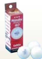
卓球 ピンポン 販売品 [コード] 13002-26