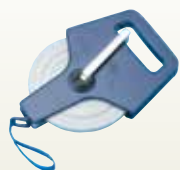
メジャー 50m サイズ:50m [コード] 13024-16