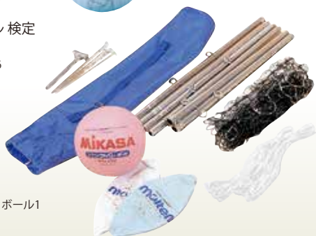
ソフトバレー ボール6 ネット1 ボール1 [コード] 13006-61