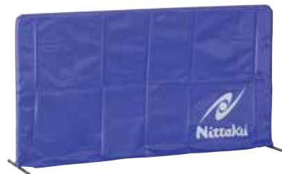
卓球 防球フェンス カバー付 サイズ:W1,400×H750 [コード] 13002-30