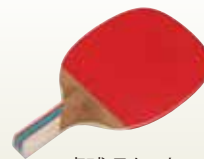
卓球 ラケット [コード] 13002-21