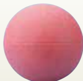
ドッジボール [コード] 13005-41