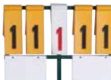
得点板[1-99] SB-16 サイズ:W680×D680×H1,400 [コード] 13024-51