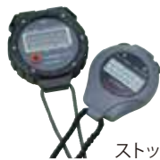
ストップウォッチ 6径 サイズ:φ60 [コード] 13024-11