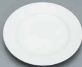
皿取皿用陶器製 20径 サイズ: φ195 [コード] 11102-21