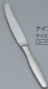
ナイフ 20-24 サイズ:L200-240 [コード] 11105-06