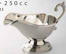
ソースポット 250cc [コード] 11103-13