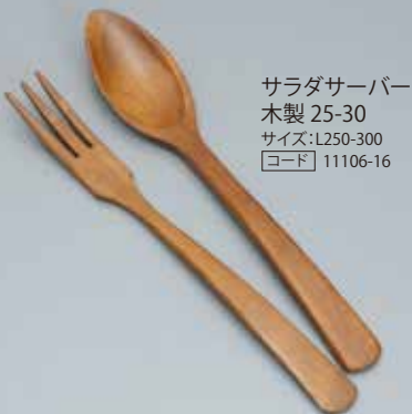
サラダサーバー 木製 25-30 サイズ:L250-300 [コード] 11106-16