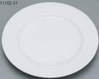
皿ディナー用陶器製 26径 サイズ: φ260 [コード] 11102-51