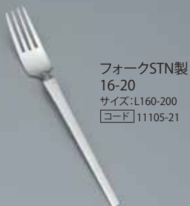
フォークSTN製 16-20 サイズ:L160-200 [コード] 11105-21