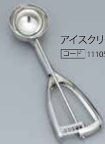
アイスクリームデッシャー [コード] 11105-81