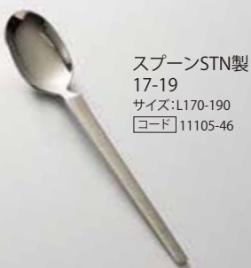
スプーンSTN製 17-19 サイズ:L170-190 [コード] 11105-46