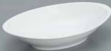
皿カレー用陶器製 舟型 サイズ: φ10インチ [コード] 11102-41