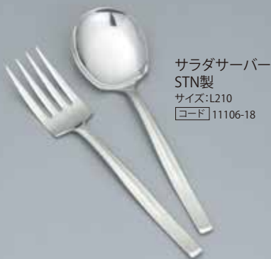
サラダサーバー STN製 サイズ:L210 [コード] 11106-18