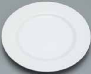
皿ライス用陶器製 21径 サイズ: φ210 [コード] 11102-31