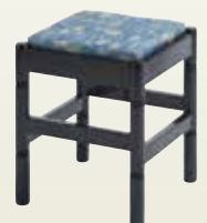
和風椅子 背無 サイズ:W370×D370×H440 [コード] 12151-51