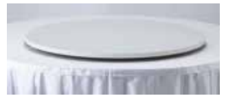
ターンテーブル天板 110径 白 サイズ:φ1,100 H28 [コード] 12157-11

テーブルクロス ストッパー 30mm厚用 サイズ:30~50cmに 1個を目安 [コード] 12159-30