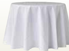
クロス 円卓用 900φ 無地白 サイズ:2,300φ [コード] 12158-10