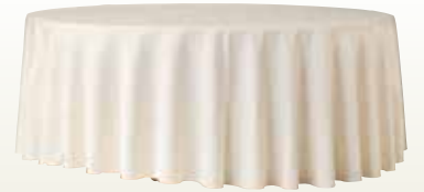
クロス 円卓用 1800φ ベージュ サイズ:3,100φ [コード] 12158-18