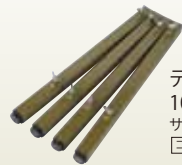
テーブル角型・長型用 10cm付足 4本組 サイズ:W30×D30×H540 [コード] 12152-91