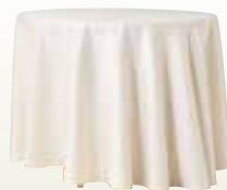
クロス 円卓用 900φ ベージュ サイズ:2,200φ [コード] 12158-09