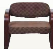
ローチェアー L C-3 サイズ:W560×D460×H460 [コード] 12153-51