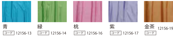
青 [コード] 12156-13 緑 [コード] 12156-14 桃 [コード] 12156-16 紫 [コード] 12156-17 金茶 [コード] 12156-19