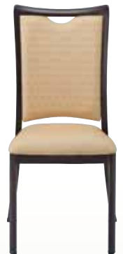
レセプションチェア SCS-4100 サイズ:W505×D565×H955 [コード] 12153-21