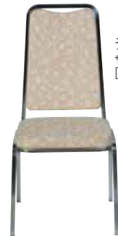
ディナー椅子 サイズ:W450×D500×H910 [コード] 12153-11