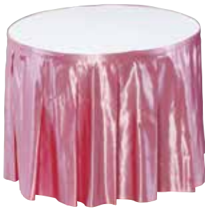
スカート 150・70 サイズ:L1,500×H700