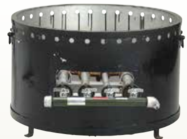
大鍋用コンロ LP サイズ: φ800 H500 〔コード〕12109-26