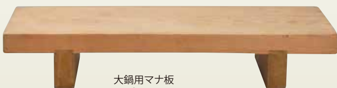
大鍋用mana板 サイズ: W1,200×D480×H200 〔コード〕12109-36