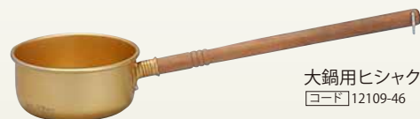
大鍋用ヒシヤク 〔コード〕12109-46