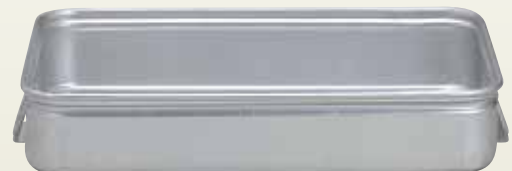
大鍋用番重 サイズ: W660×D450×H120 〔コード〕12109-41