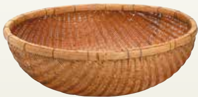
大鍋用ザル サイズ: φ1,000 H350 〔コード〕12109-31