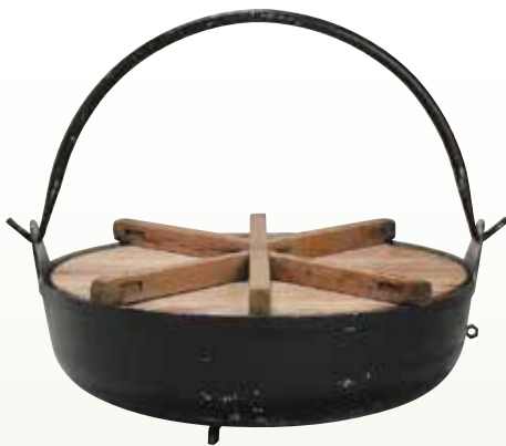
大鍋用 鍋 サイズ: φ1,040 H350 〔コード〕12109-21