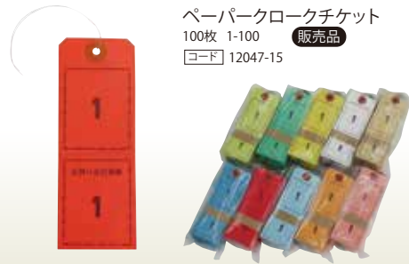
ペーパークロークチケット 100枚 1-100 販売品 [コード] 12047-15