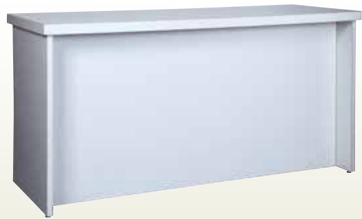
受付カウンター 180・70・90 サイズ:W1,800×D700×H900 [コード] 15146-37