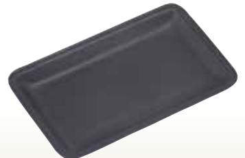
名刺受用盆 本革 黒 サイズ:W215×D133×H20 [コード] 12046-51