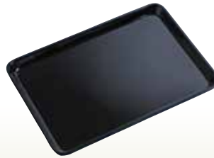
名刺受用盆 サイズ:W200×D130 [コード] 12046-41