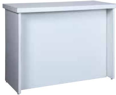
受付カウンター 120・60・90 サイズ:W1,200×D600×H900 [コード] 15146-35