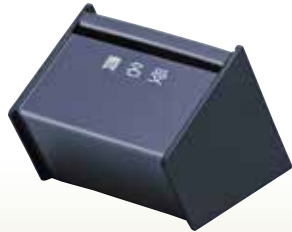
貴名受箱 サイズ:W90×D100×H150 [コード] 12046-31