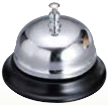
呼びりん サイズ:φ75 H50 [コード] 12060-11