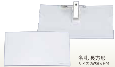
名札 長方形 サイズ:W56×H91 [コード] 12047-21 ※用紙は付いていません