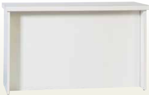
受付カウンター 150・60・90 サイズ:W1,500×D600×H900 [コード] 15146-36