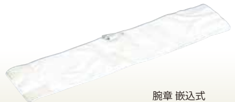
腕章 嵌込式 サイズ:W90×L380 [コード] 12047-31