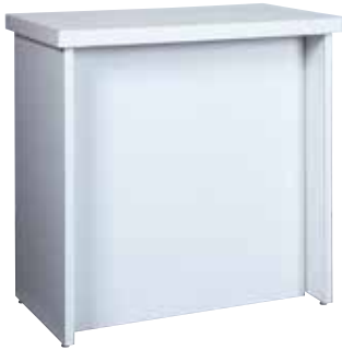
受付カウンター 90・60・90 サイズ:W900×D600×H900 [コード] 15146-33