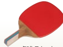
卓球 ラケット [コード] 13002-21