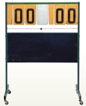
得点板 [1-199] サイズ:W965×D500×H1,300 [コード] 13006-31