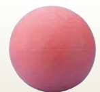
ドッジボール [コード] 13005-41