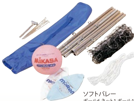
ソフトバレー ボール6 ネット1 ボール1 [コード] 13006-61