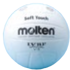
バレーボール 検定 公式用 [コード] 13006-16