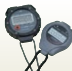
ストップウォッチ 6径 サイズ:φ60 [コード] 13024-11