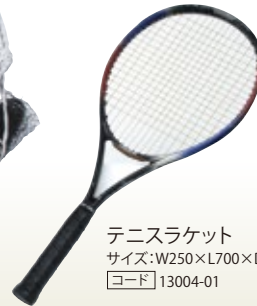
テニスラケット サイズ:W250×L700×D350 [コード] 13004-01