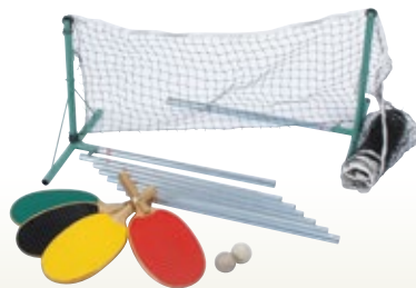
フリーテニス [コード] 13017-31