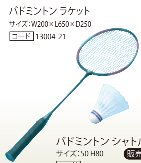
バドミントンラケット サイズ:W200×L650×D250 [コード] 13004-21