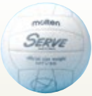
バレーボール [コード] 13006-11