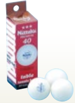
卓球 ピンポン 販売品 [コード] 13002-26