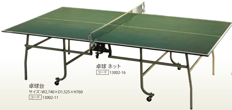
卓球 ネット [コード] 13002-16