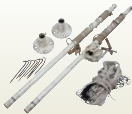
バレー用ネット 11m サイズ:L11m×H400 ママさんバレー [コード] 13006-21