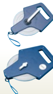
メジャー 50m サイズ:50m [コード] 13024-16