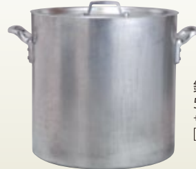
鍋 寸胴白打出し 51径 サイズ: φ510 H510 [コード] 11125-15