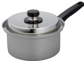
鍋 片手鍋 18径 IH200V対応 サイズ: φ174 H95 2.3L [コード] 11126-18