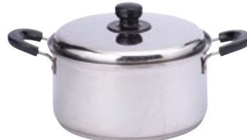
鍋 両手鍋 24径 IH200V対応 サイズ: φ240 H120 5.3L [コード] 11126-24