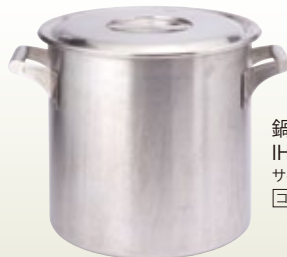
鍋 寸胴 36径 IH200V対応 サイズ: φ360 H360 30L [コード] 11126-36