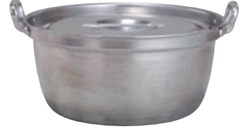
鍋 鋳物白打出し 54径 サイズ: φ540 H255 [コード] 11125-25