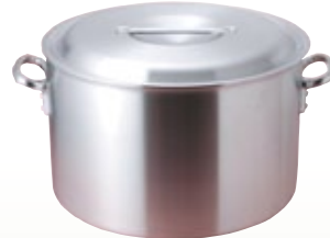
鍋 半寸胴 45径 サイズ: φ450 H290 [コード] 11125-64