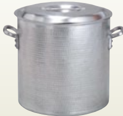
鍋 寸胴白打出し 36径 サイズ: φ360 H360 [コード] 11125-11