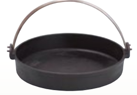
鍋 すきやき [コード] 11125-51