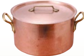
鍋 半寸胴 銅製 40径 サイズ: φ400 H240 [コード] 11125-74