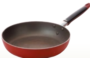
フライパン 26 サイズ: φ260 [コード] 11127-11