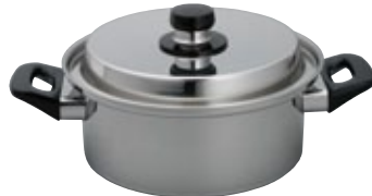
鍋 両手鍋 20径 IH200V対応 サイズ: φ198 H95 2.8L [コード] 11126-20