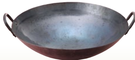
中華鍋 鉄製 サイズ: φ330 H85 [コード] 11133-11