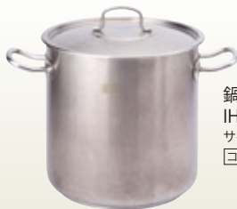
鍋 寸胴 30径 IH200V対応 サイズ: φ300 H300 21.2L [コード] 11126-30