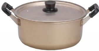
鍋 アルミ製 33径 サイズ: φ330 H140 [コード] 11125-31