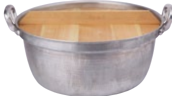
鍋 鋳物白打出し 51径 サイズ: φ510 H255 [コード] 11125-23