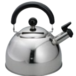
やかん 2.5L IH200V対応 [コード] 11139-25