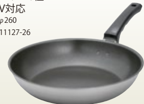
フライパン 26径 IH200V対応 サイズ: φ260 [コード] 11127-26