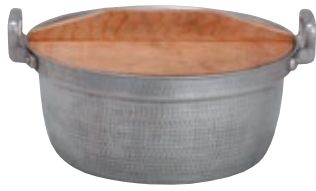
鍋 鋳物白打出し 45径 サイズ: φ450 H200 [コード] 11125-21