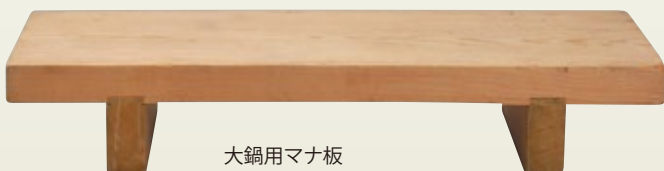
大鍋用マナ板 サイズ: W1,200×D480×H200 [コード] 12109-36