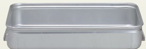
大鍋用番重 サイズ: W550×D370×H100 [コード] 12109-41