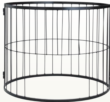
大鍋用 柵 サイズ: φ1,300 H800 [コード] 12109-51