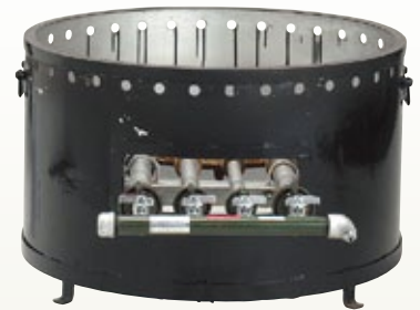
大鍋用コンロ LP サイズ: φ800 H500 [コード] 12109-26