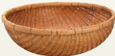
大鍋用ザル サイズ: φ1,000 H350 [コード] 12109-31