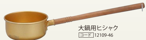
大鍋用ヒシヤク [コード] 12109-46