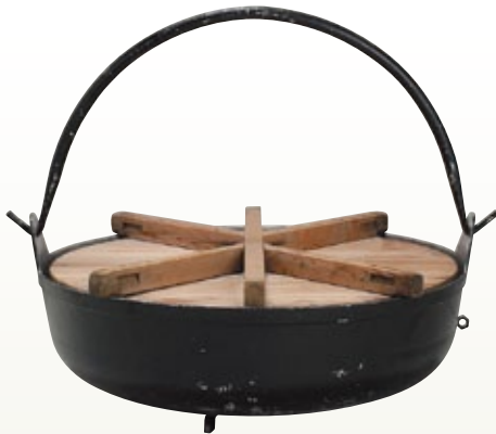
大鍋用 鍋 サイズ: φ1,040 H350 [コード] 12109-21