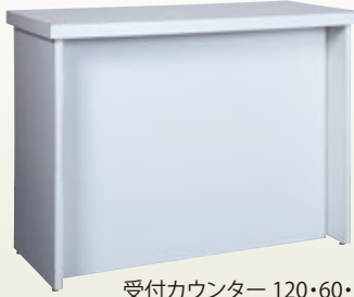
受付カウンター 120・60・90 サイズ:W1,200×D600×H900 [コード] 15146-35