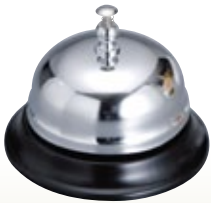
呼びりん サイズ:φ75 H50 [コード] 12060-11