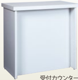
受付カウンター 90・60・90 サイズ:W900×D600×H900 [コード] 15146-33