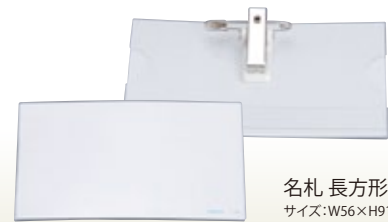
名札 長方形 サイズ:W56×H91 [コード] 12047-21 ※用紙は付いていません