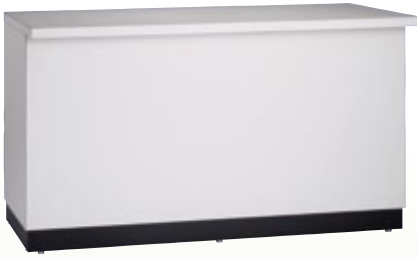
受付カウンター 150 H90 サイズ:W1,500×D600×H900 [コード] 15146-25