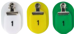
クローク札 クリップ付 親子 白 サイズ:W40×H60・W30×H45 [コード] 12047-12