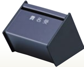
貴名受箱 サイズ:W90×D100×H150 [コード] 12046-31