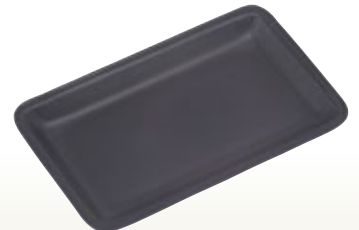
名刺受用盆 本革 黒 サイズ:W215×D133×H20 [コード] 12046-51