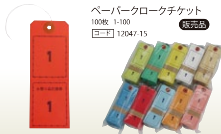
ペーパークロークチケット 100枚 1-100 [コード] 12047-15