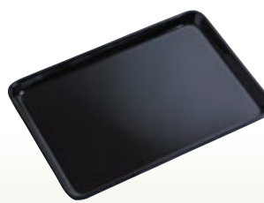
名刺受用盆 サイズ:W200×D130 [コード] 12046-41