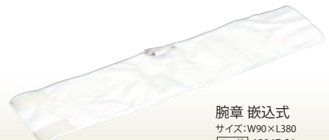
腕章 嵌込式 サイズ:W90×L380 [コード] 12047-31