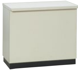
受付カウンター 100 H90 サイズ:W1,000×D600×H900 [コード] 15146-13