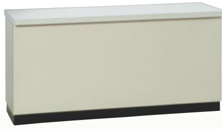
受付カウンター 180 H90 サイズ:W1,800×D600×H900 [コード] 15146-31