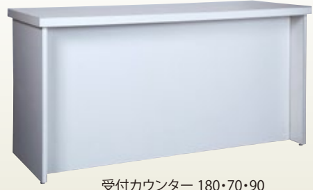
受付カウンター 180・70・90 サイズ:W1,800×D700×H900 [コード] 15146-37