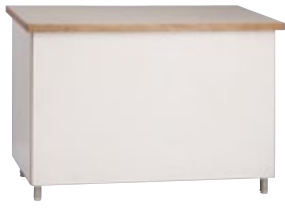
受付カウンター 100 H70 サイズ:W1,000×D600×H700 [コード] 15146-11