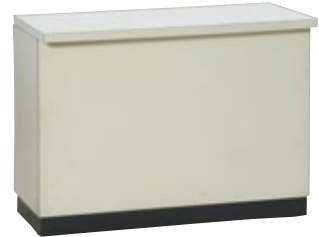
受付カウンター 120 H90 サイズ:W1,200×D600×H900 [コード] 15146-21