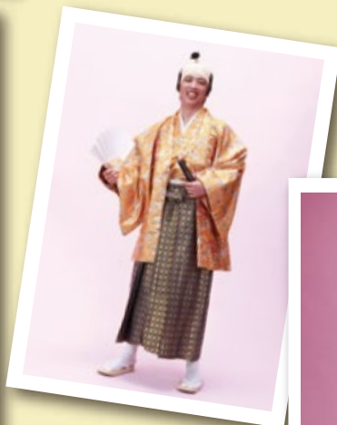
大名セット [コード] 16003-33