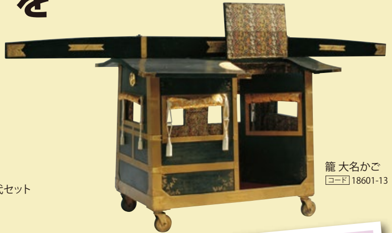
籠 大名かご [コード] 18601-13