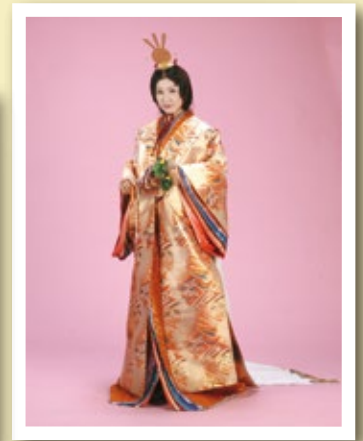
十二単セット [コード] 16003-10 ※裾をすらないようご注意ください。