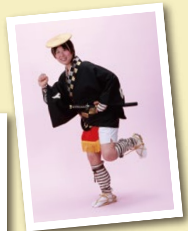
奴さんセット [コード] 16004-71