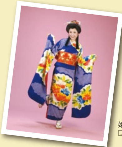
姫様 江戸時代セット [コード] 16003-77