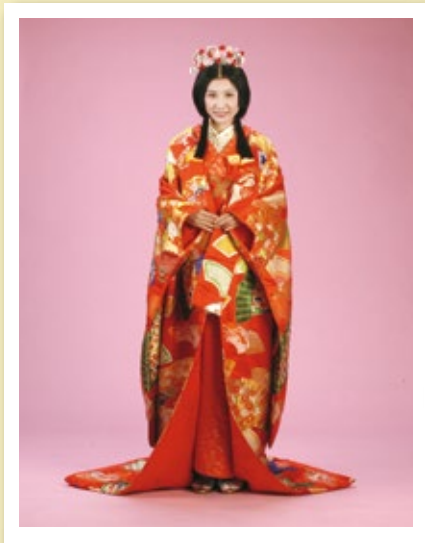
姫様 和装セット [コード] 16003-75 ※裾をすらないようご注意ください。