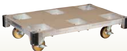
パイプ台車アルミ製 1221×771 [コード]03174-15