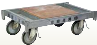
パイプ台車 1200×800 [コード]03174-11