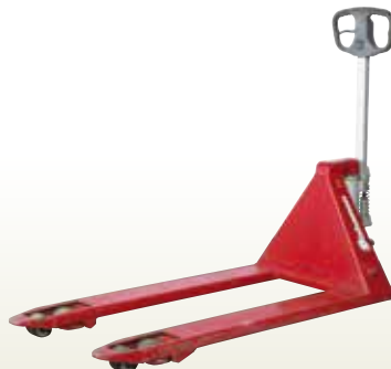
キャッチ・パレット 3t [コード]03172-30