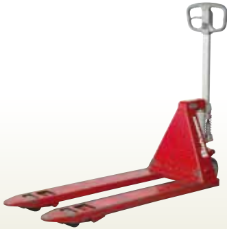
キャッチ・パレット 1.5t [コード]03172-15