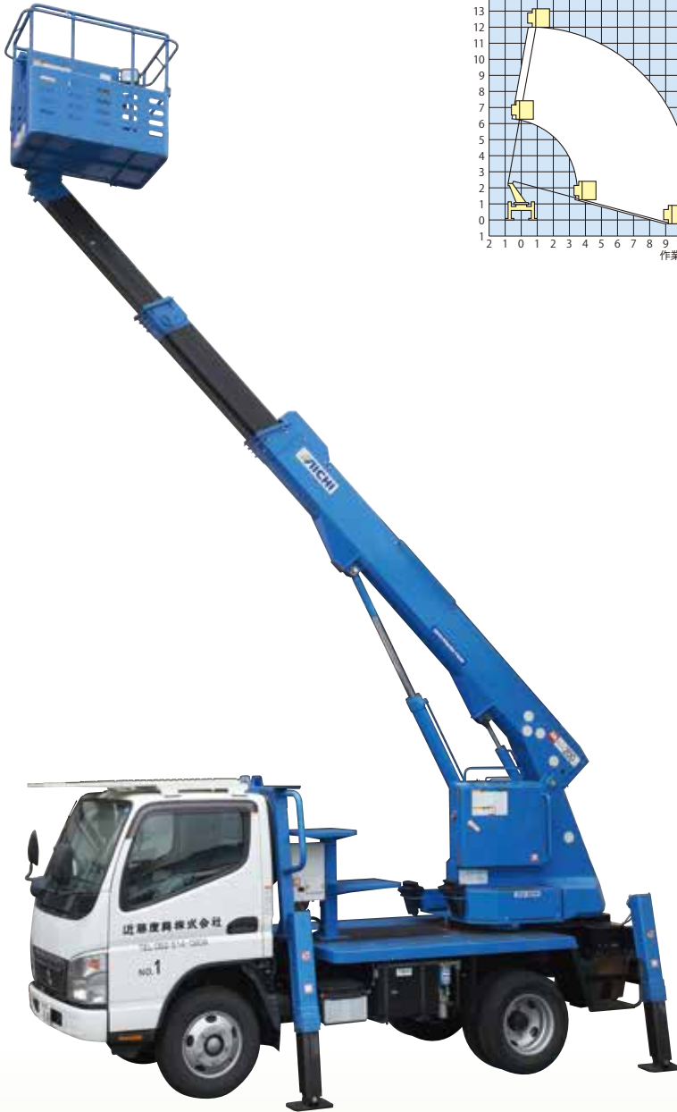
スカイマスター直伸 12 [コード]03157-09