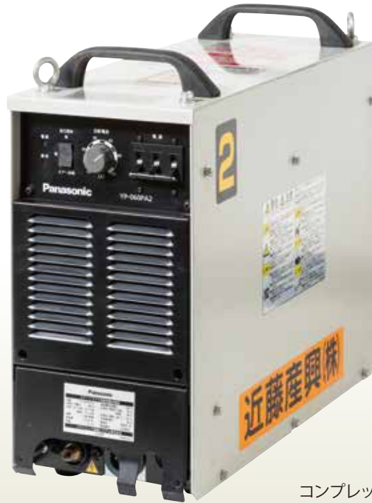
コンプレッサ内蔵型