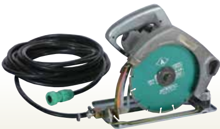
コンクリートカッター ハンド式 [コード]03098-01