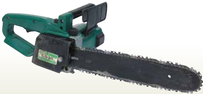
電気チェーンソー 単相100 [コード]03151-01