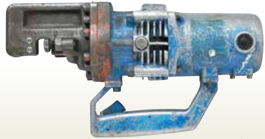
鉄筋カッター 19mm [コード]03107-19