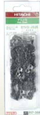
電気チェーンソー刃 (販売) [コード]03151-09