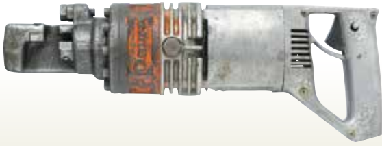
鉄筋カッター 13mm [コード]03107-13