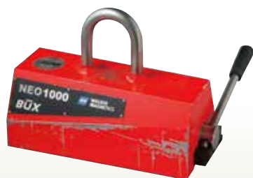
永磁リフティングマグネット NEO1000 [コード]03114-20