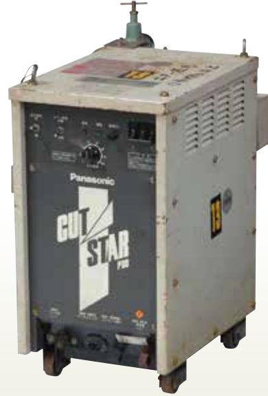
エアープラズマ切断機 P80 [コード] 03070-21