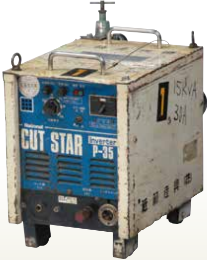
エアープラズマ切断機 P35 [コード] 03070-11