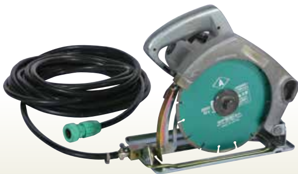
コンクリートカッター ハンド式 [コード] 03098-01