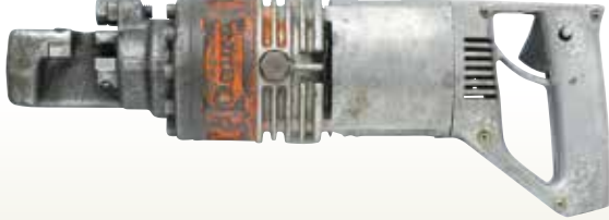
鉄筋カッター 13mm [コード] 03107-13