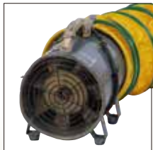
ダクト 200mm5m [コード]03155-20