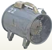
送風機 200mm [コード]03154-20