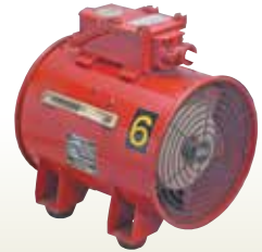
送風機 [防爆型] 300mm [コード]03154-31