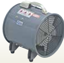
送風機 300mm [コード]03154-30