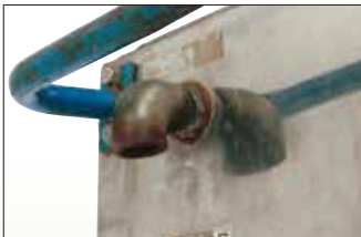
配管取付口 (水道管直結)