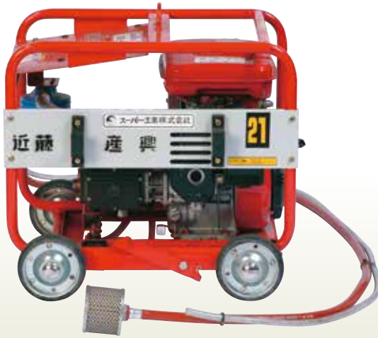
高圧洗浄機 E式 ガソリン [コード] 03052-12